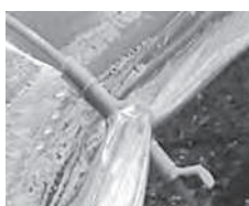
被覆材の留め具です ↓