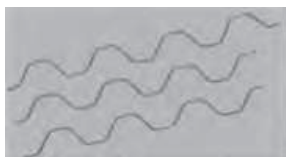
タフコートスプリング