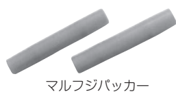
マルフジパッカー