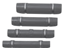
カセットストロング