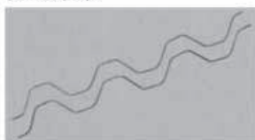
タフスプリング(ステン)