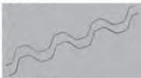
タフスプリング(ステン)