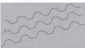
スーパースプリング(PO専用)