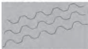
スーパースプリング(PO専用)